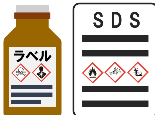
化学品のラベル・SDS のイメージ