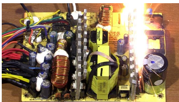
図2 浸水による通電火災のイメージ

(水に濡れた家電製品の内部には、水分が残っていたり、泥や塩分などの異物が付着していたりすることがあるため、通電時に電気回路基板から発火するおそれがあります。)