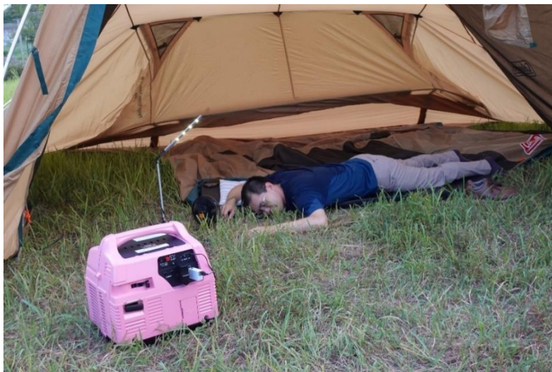
図1 一酸化炭素中毒事故のイメージ (テント入口で携帯発電機を使用)