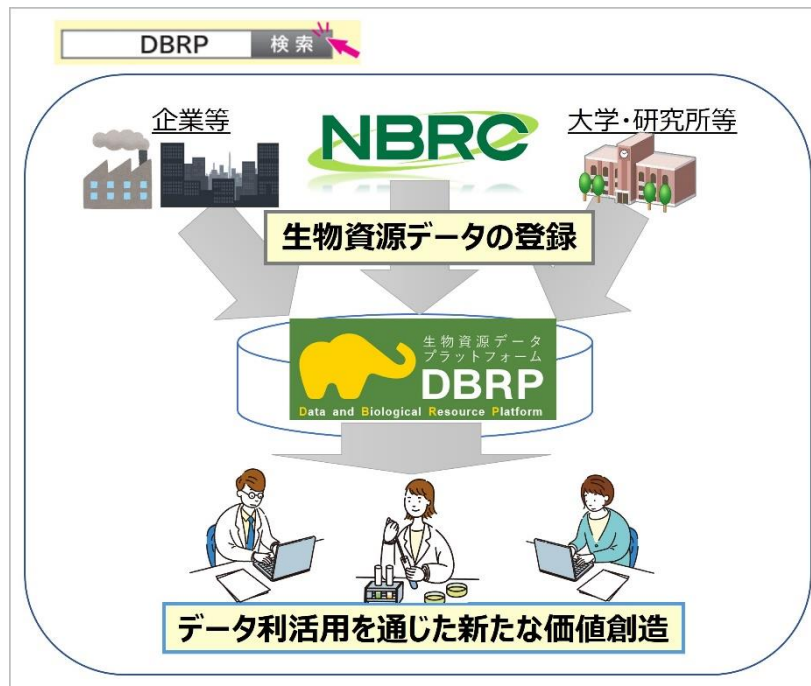
図1. DBRPを通じた微生物資源とその関連データの利活用

資源データプラットフォーム（DBRP）」を構築し、公開しています。「DBRP」には、NITEが保有する5万株を超える微生物資源とその関連データ（微生物の特性情報、オミックス情報など）に加えて、企業や公設試験研究所、大学が保有する生物資源情報を収載しています。「DBRP」を通して、微生物資源とその関連データの利活用を促進し、イノベーションの創出や産業の発展に貢献しています。（図1）