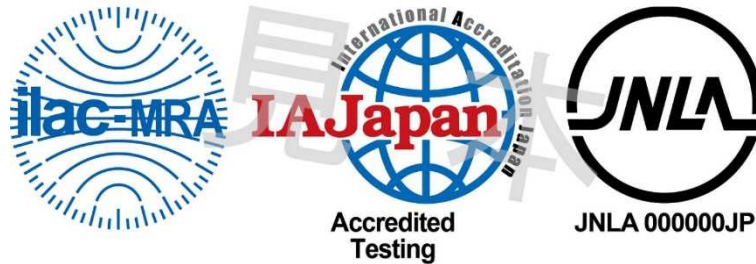
図1 ILAC MRA 組み合わせ認定シンボル

備考:ILAC MRA マークは ILAC により国際商標登録されている。(国際登録番号:840857)