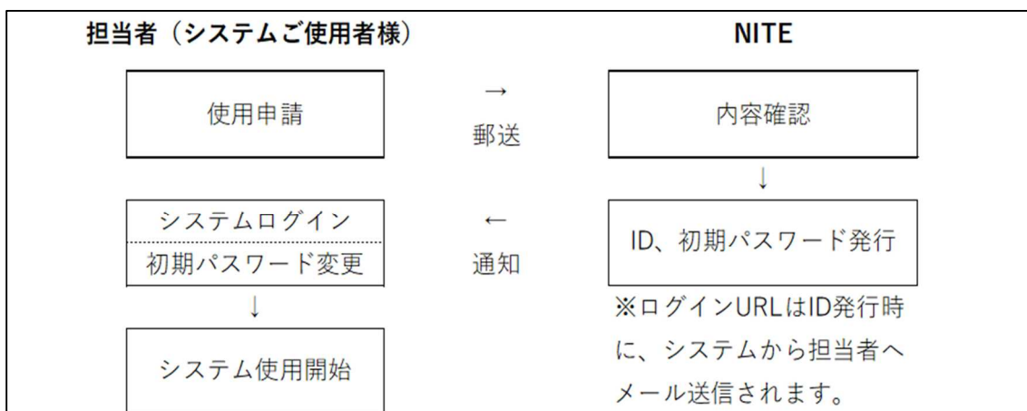
図2 システム使用申請～使用開始のフロー