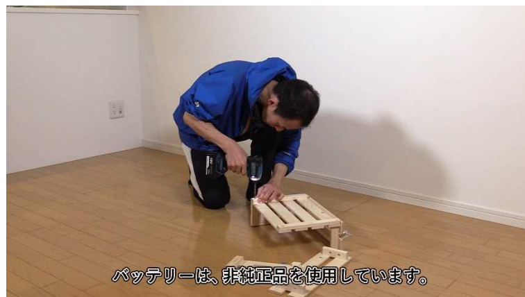
写真 静止画例 1

提供する映像へのクレジットは「製品評価技術基盤機構+nite ロゴ」としてください。