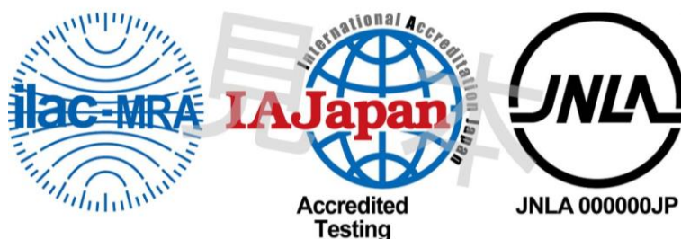
図1 ILAC MRA 組み合わせ認定シンボル

備考:ILAC MRA マークは ILAC により国際商標登録されている。(国際登録番号:840857)