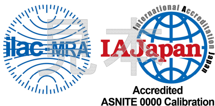
図1 認定事業者が使用できる認定シンボル

認定事業者は、認定された範囲について、図1のILAC MRA組み合わせ認定シンボルの使用及び認定要求事項に適合している旨の記載ができる。認定シンボルを使用する場合は、別に定める「IAJapan認定シンボルの使用及び認定の主張等に関する方針」に掲げる事項を遵守すること。