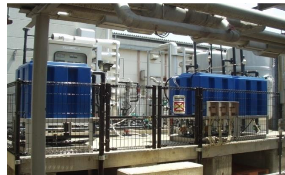
(写真12. 井水上水化装置)