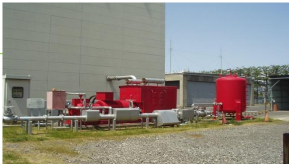
(写真1. 危険物倉庫の高発泡消火施設)