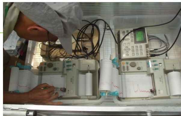
(写真8. 騒音振動測定2)