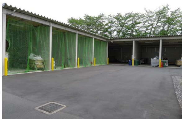
(写真11. 廃棄物置き場)