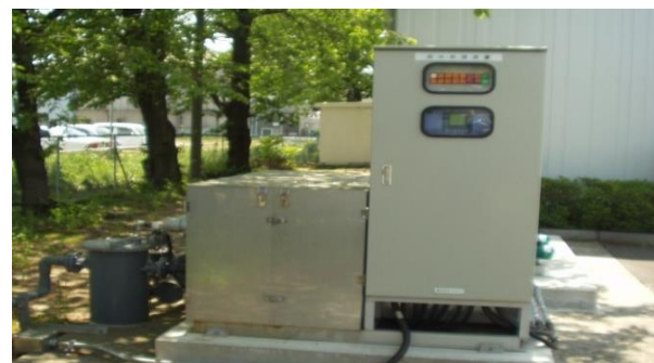
(写真4. 下水道への排水中和施設)