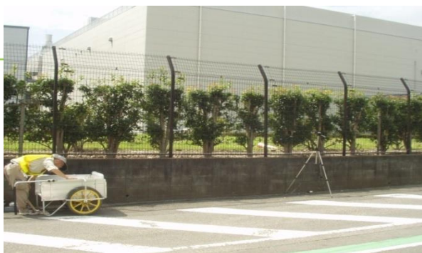
(写真7. 騒音振動測定1)