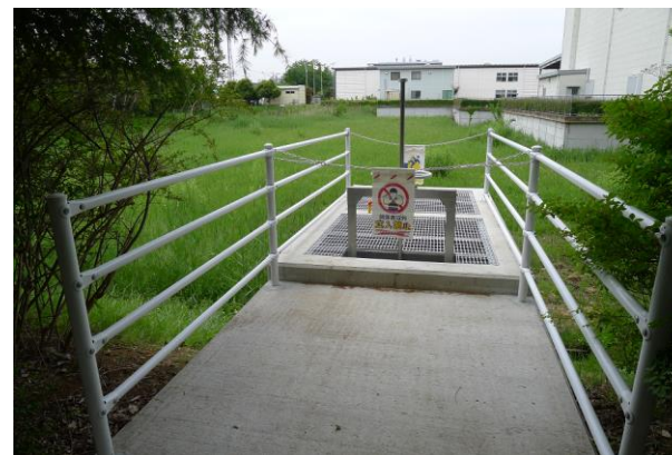
(写真6. 遊水池から公共水域への水門)