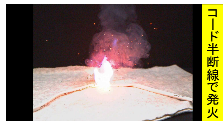
コード半断線で発火