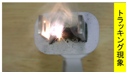
トラッキング現象