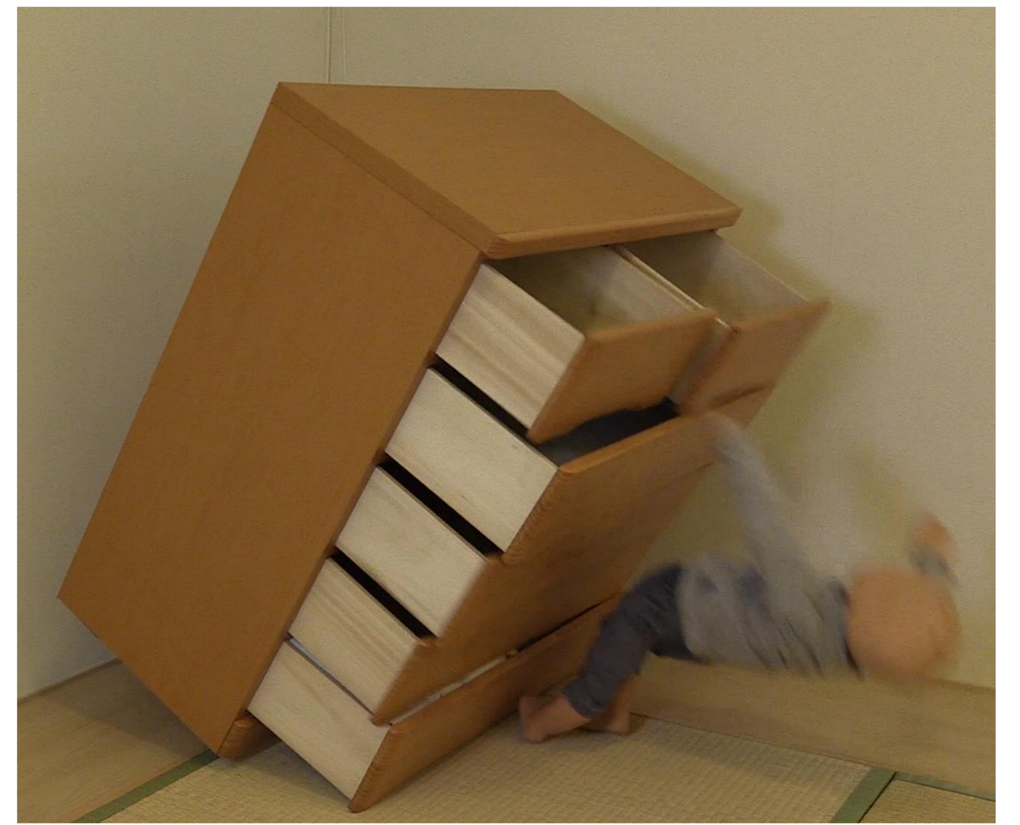
(写真)たんすによじ登って転倒(イメージ)

【事例③】保護者が目を離した隙に、乳児がつかまり立ちをして蒸気吹き出し口に手をついてしまったものです。