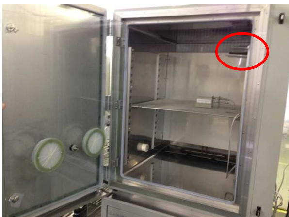
図1 恒温槽(温度試験槽)の例 (右上の丸囲み部分が温度計)