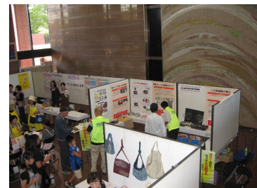
市民ホール内のNITEブース